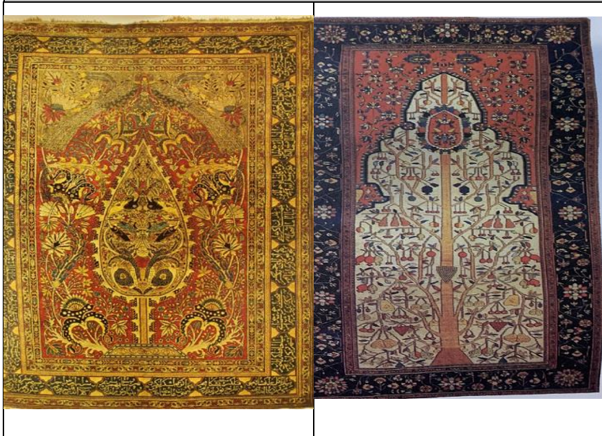
جدول ۲ - قالیچه محرابی درختی

افزودن کاربرد تزئینی به فرش‌های محرابی، از زمانی آغاز شد که فرش به‌عنوان عامل تعیین‌کننده برای قبله استفاده شد و محراب بافته‌شده بر دیوار مساجد نظیر آنچه در محراب معماری کلیسا دیده می‌شود، آویخته شد. این تغییر در کاربرد فرش محرابی موجب تولید طرح‌های متنوعی شد. همچنین جداسدن طرح محرابی از کارکرد مذهبی‌اش، ممنوعیت طراحی انسان را از میان برداشت. پس از آن نمادهای بی‌شماری در طراحی فرش محرابی حضور پیدا کرد که از مهم‌ترین آنان طرح «درخت زندگی» بود. از آنجا که تعبیر محراب با دروازه بهشت نزدیکی بسیار داشت، وجود نقوش گیاهی که یادآور باغ بهشت بودند در این طرح توجیه پذیر می‌شود. کاربرد عناصر مشخصی در طراحی که در بیشتر موارد گیاهی هستند. اما با گذر زمان و بافته‌شدن این نوع فرش‌ها در نقاط مختلف، عناصر تزئینی وابسته به این مناطق وارد طراحی شدند و هرکدام بار معنای جدیدی را به کلیت فرش محرابی افزودند؛ هرچند نقش محرابی تقریباً در همه نواحی ایران، شمال، شرق و غرب و حتی تا مصر در میان اقوام مختلف دارای حاشیه متفاوت بوده و گاه درون نقشه محراب با آویز و با نقش‌های دیگر نیز آراسته شده است (حصوری، ۱۳۸۱: ۵۶).