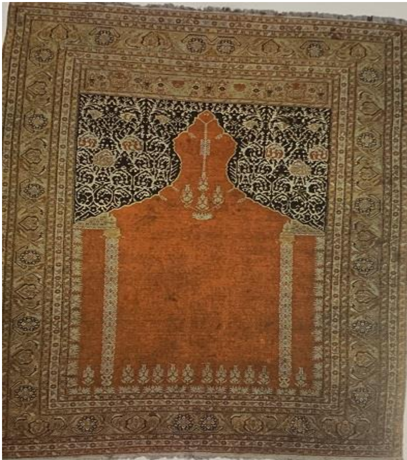
تصویر ۹ - فرش محرابی ستون‌دار

طرح کتیبه پیشانی بالای «درخت زندگی» به‌نوعی خلاصه همان درخت است که به‌صورت آیینه‌ای آمده است تا توازن رعایت‌شده در تمام بخش‌های فرش، تکرار شود. کتیبه در این جا می‌تواند نقطه اتصال میان حاشیه و طرح «درخت زندگی» و بخش مرکزی فرش باشد که به‌نوعی خلاصه‌ای از کل مجموعه است و تقریباً تمامی رنگ‌های موجود در فرش در این بخش تکرار شده است. البته طرح کتیبه معمولاً در دوره قاجار یا عبارات و اشعار فارسی بود، یا تاریخ بافت فرش ولی در این فرش خلاصه کلی رنگ‌ها و حاشیه در کتیبه آمده است.