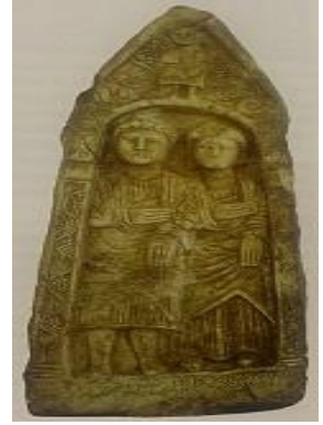
تصویر شماره ۳ - تخت خالی - اوایل مسیحیت - مجموعه بیزانس - برلین -